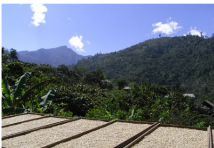
グアテマラ アソバグリ農協