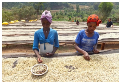
エチオピア オロミア農協／イルガチエフェ農協